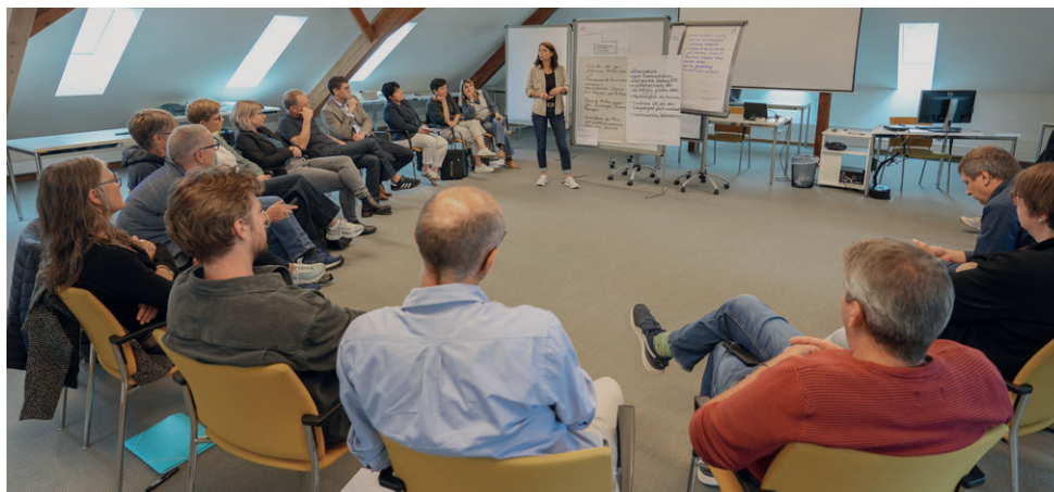
Strategietagung VSG Bischofszell

Die Schulbehörde beantragt Ihnen, die Jahresrechnung 2025 mit einem Aufwandsüberschuss von CHF 355'345.05 zu genehmigen.