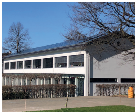
Brandschutzmassnahmen Turnhalle Hauptwil